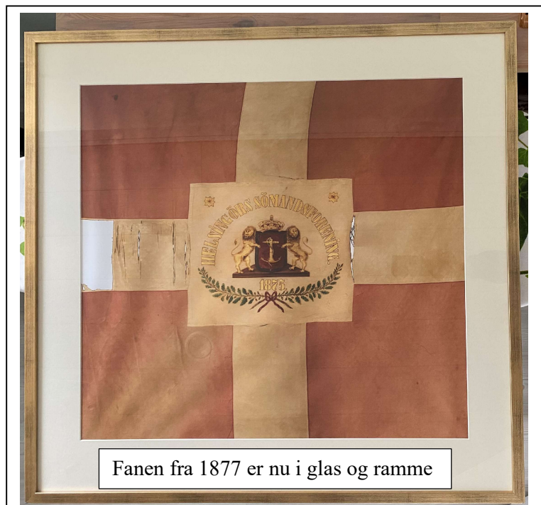
Fanen fra 1877 er nu i glas og ramme

Som begrundelse nævnte bestyrelsen at dette er første gang i 20 år at vi foreslår at sætte kontingentet op. Alt er blevet dyrere i løbet af de sidste 20 år, og for at få lidt penge samlet sammen til at holde et 150-års jubilæum for, så er det nødvendigt. Forslaget blev vedtaget. I denne sammenhæng er det værd at nævne, at flere medlemmer allerede har bidraget med donationer, øremærket ' jubilæet '.