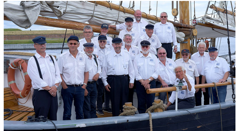
Shantykoret har ved flere lejligheder optrådt på skonnerten Zar. Her i 2022.